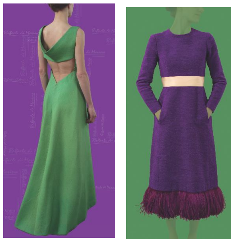
Robes Di Marino, d'après un modèle Givenchy